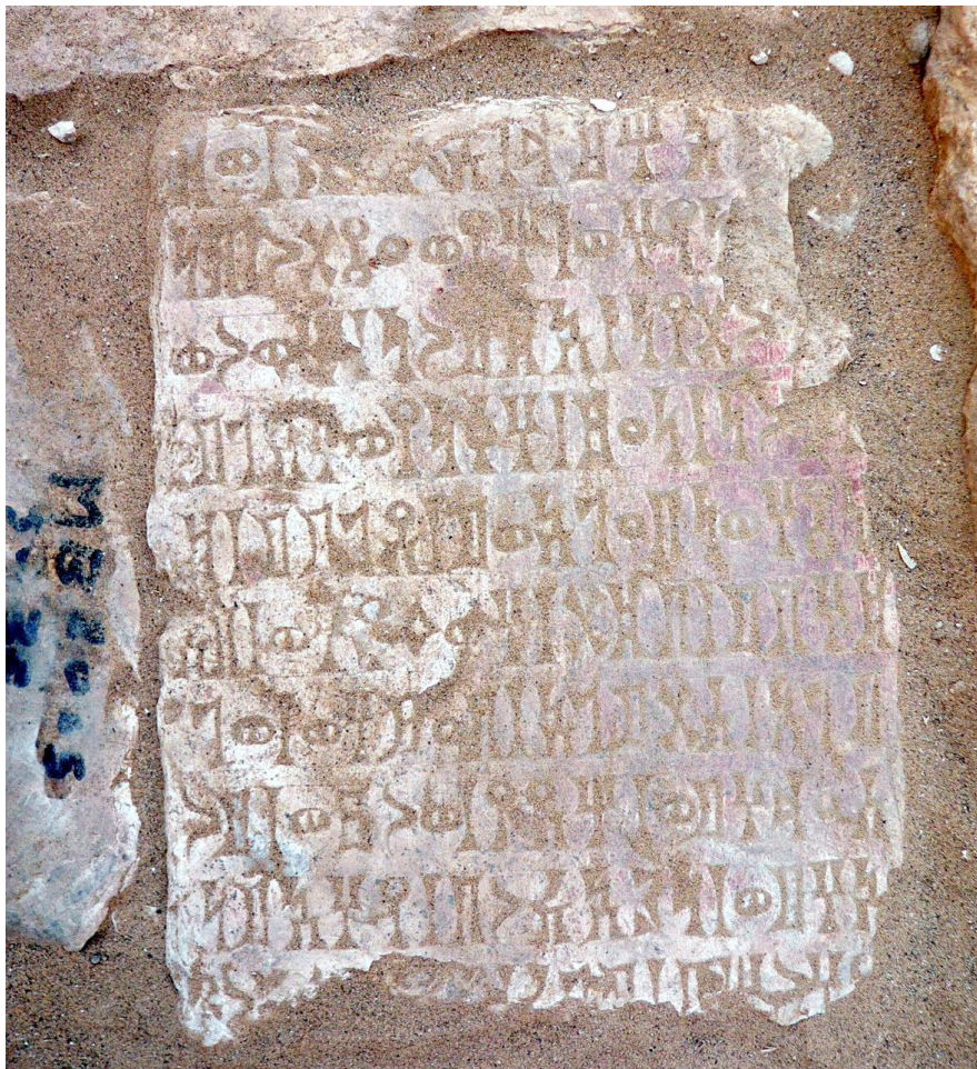
لوحة رقم (٣)