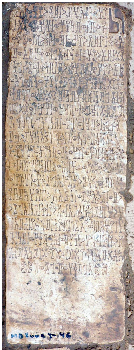
لوحة رقم (٢)