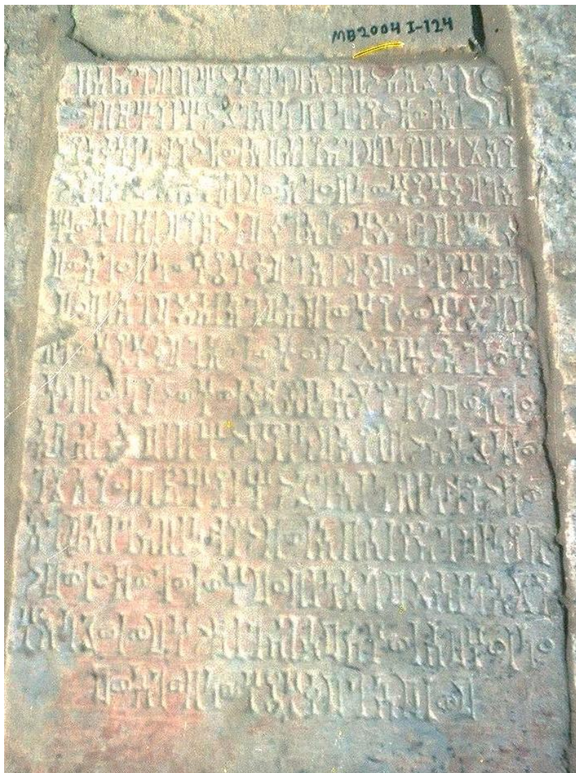
لوحة رقم (١)